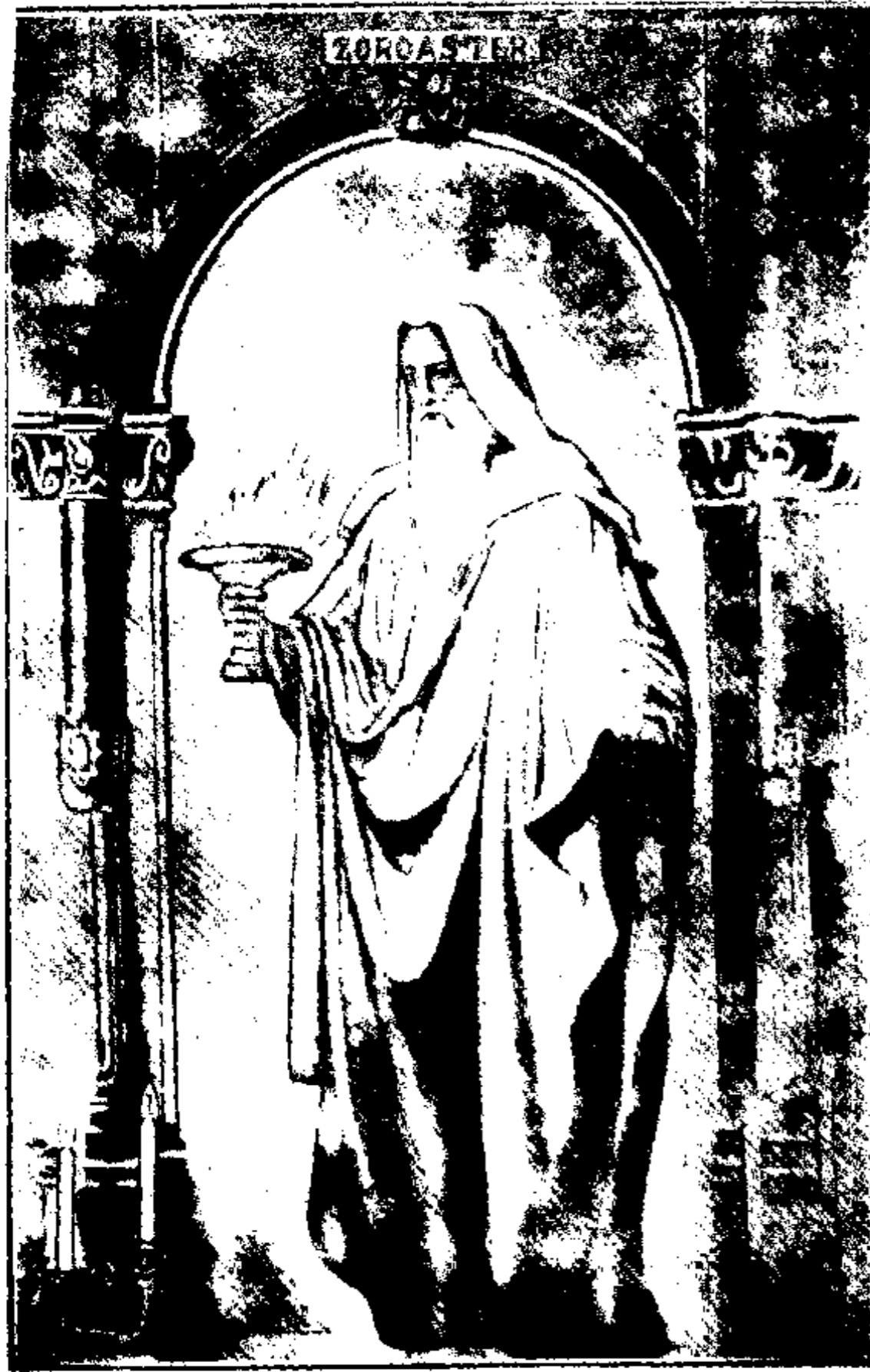
نکاره‌یی از زرتشت از نقاشی نامعلوم که در تالار نقاشی « درسدن Dresden » می‌باشد