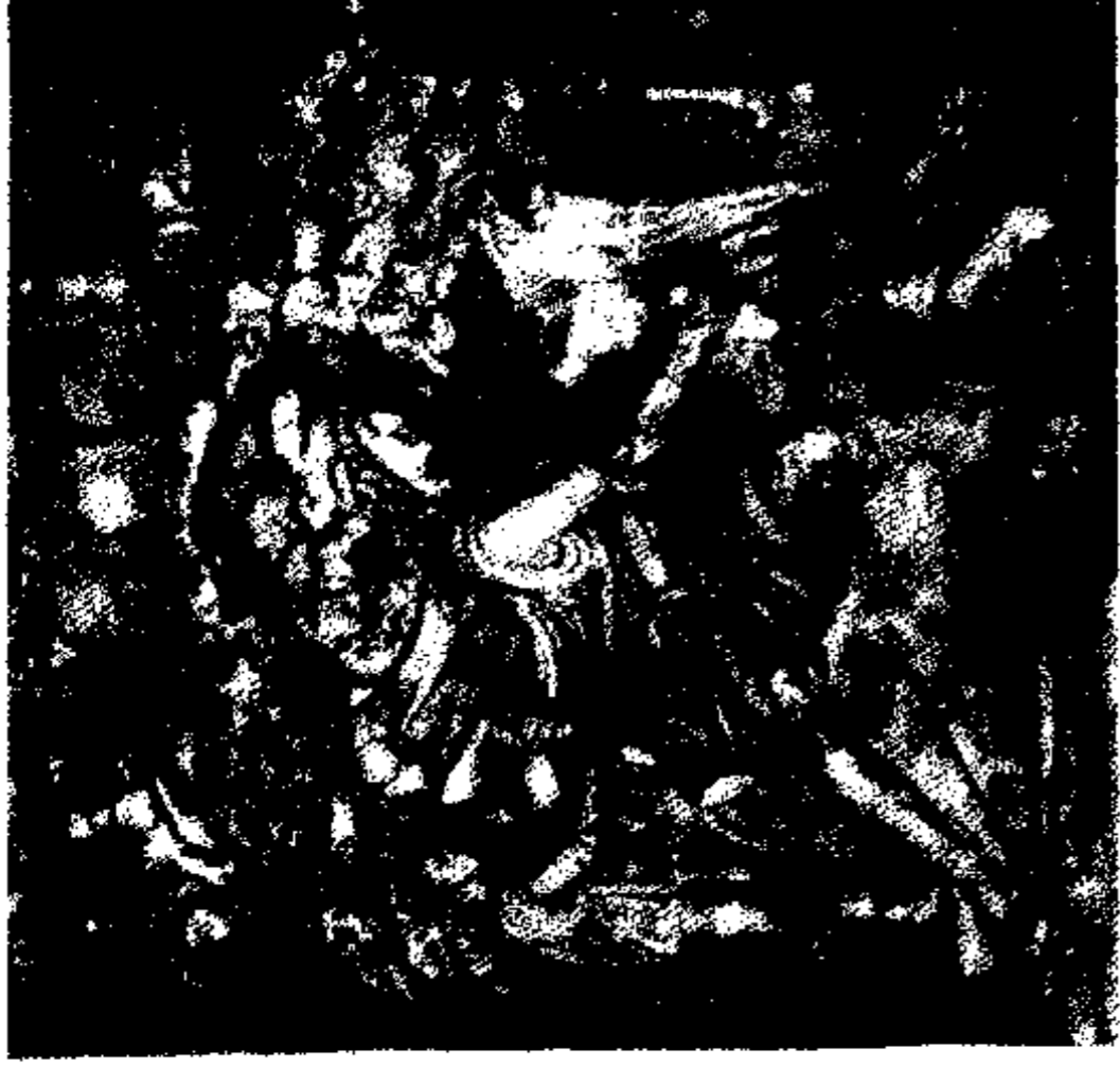
میترا نیسم در اروپا با تأثیر از فلسفه و افسانه‌های اروپایی بنیانی یافت و روایاتی بسیار دربارهٔ مهر، بر مبنای اساطیر یونانی ساخته شد. در این تصویر مبارزه میترا با گاو حجاری شده است