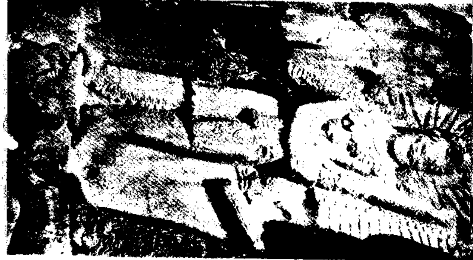
این نقش برجسته که در تخت بستان وجود دارد، میترا را نشان می دهد - اما اهل تحقیق مدتهایی این بیکر را از زرتشت و پس از آن از اهورامزدا میدانستند