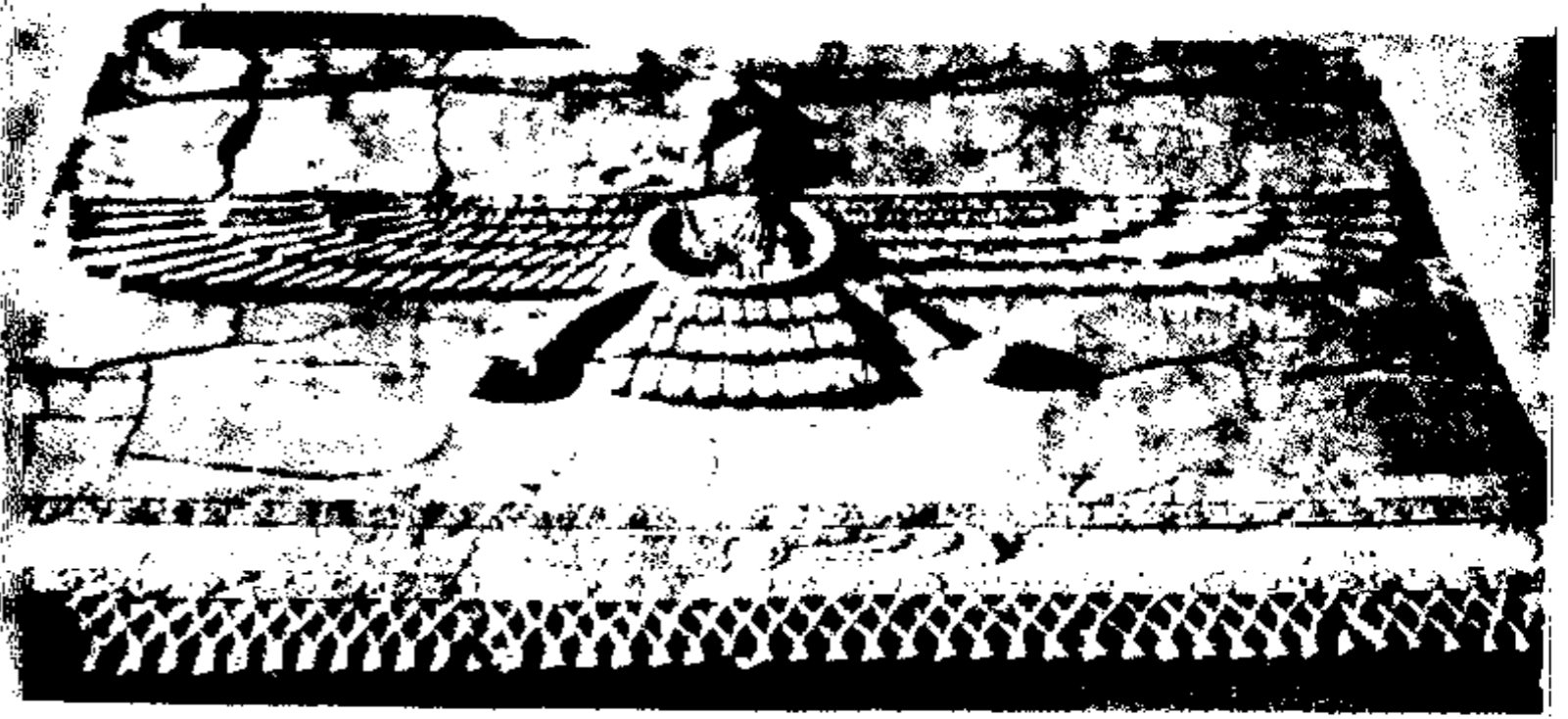
نگارهٔ فروهر بر بالای درگاه سنگی کاخ مرکزی تخت جمشید.