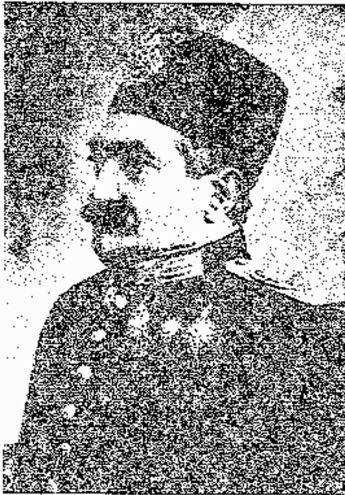
پندگ شکل السلطان

سپس نیز که پس از دو ماه روزنامه اش بیرون آمد داستان دادگاه را نوشت و بمحمد علی میرزا بدگویی دروغ نگفت . این بود در پیشامد بمباردگان مجلس که سلطان العلماء نیز یکی