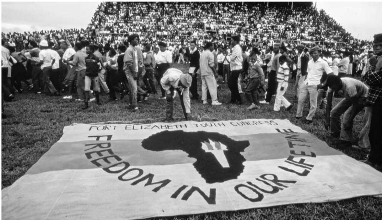
سوگواران در مراسم تشییع جنازه کسانی که در شهرک لانگیا در یونینهاگ به دست پلیس آفریقای جنوبی کشته شدند/ ۲۱ مارس ۱۹۸۵، استان کیپ، آفریقای جنوبی