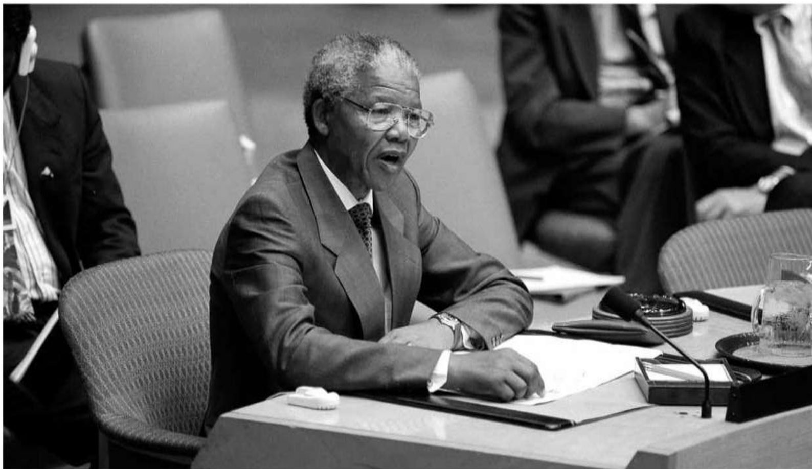
سخنرانی نلسون ماندلا، رئیس کنگره ملی آفریقا، خطاب به شورای امنیت / ۱۵ ژوئیه ۱۹۹۲، سازمان ملل متحد، نیویورک، ایالات متحده آمریکا