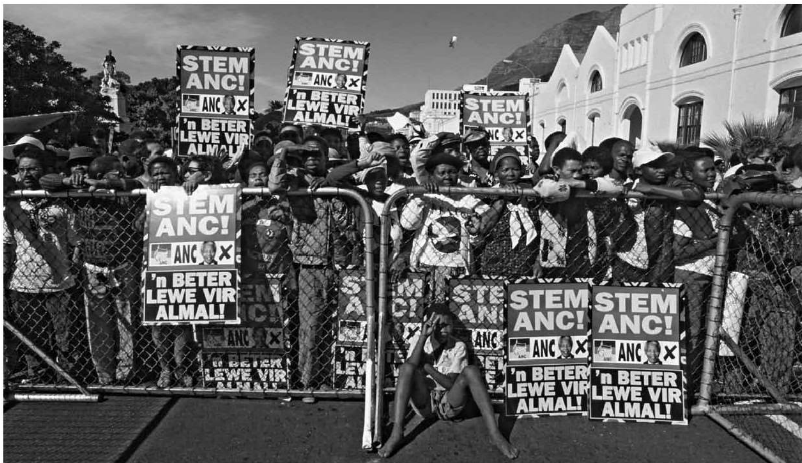
جمعیت شادمان از پیروزی به سخنان نلسون ماندلا در افتتاحیه ریاست او به عنوان نخستین رئیس جمهوری سیاهپوست آفریقای جنوبی گوش می دهند. / ۱۰ مه ۱۹۹۴، پره توریا، آفریقای جنوبی