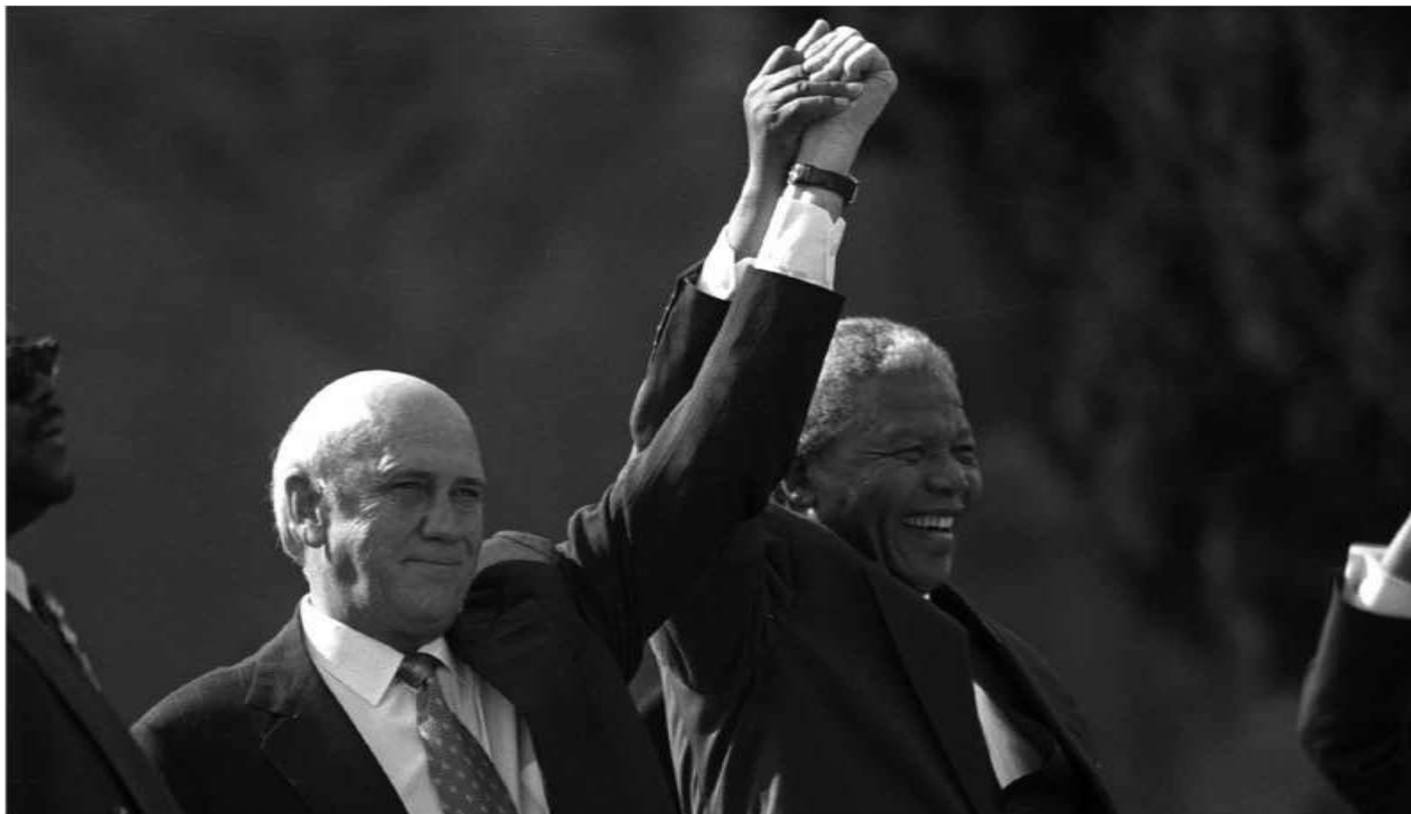
پرزیدنت اف دلیو. دکلرک رییس سابق کشور و نلسون ماندلا پس از مراسم افتتاح ریاست جمهوری ماندلا / ۱۰ مه ۱۹۹۴، پره توریا، آفریقای جنوبی