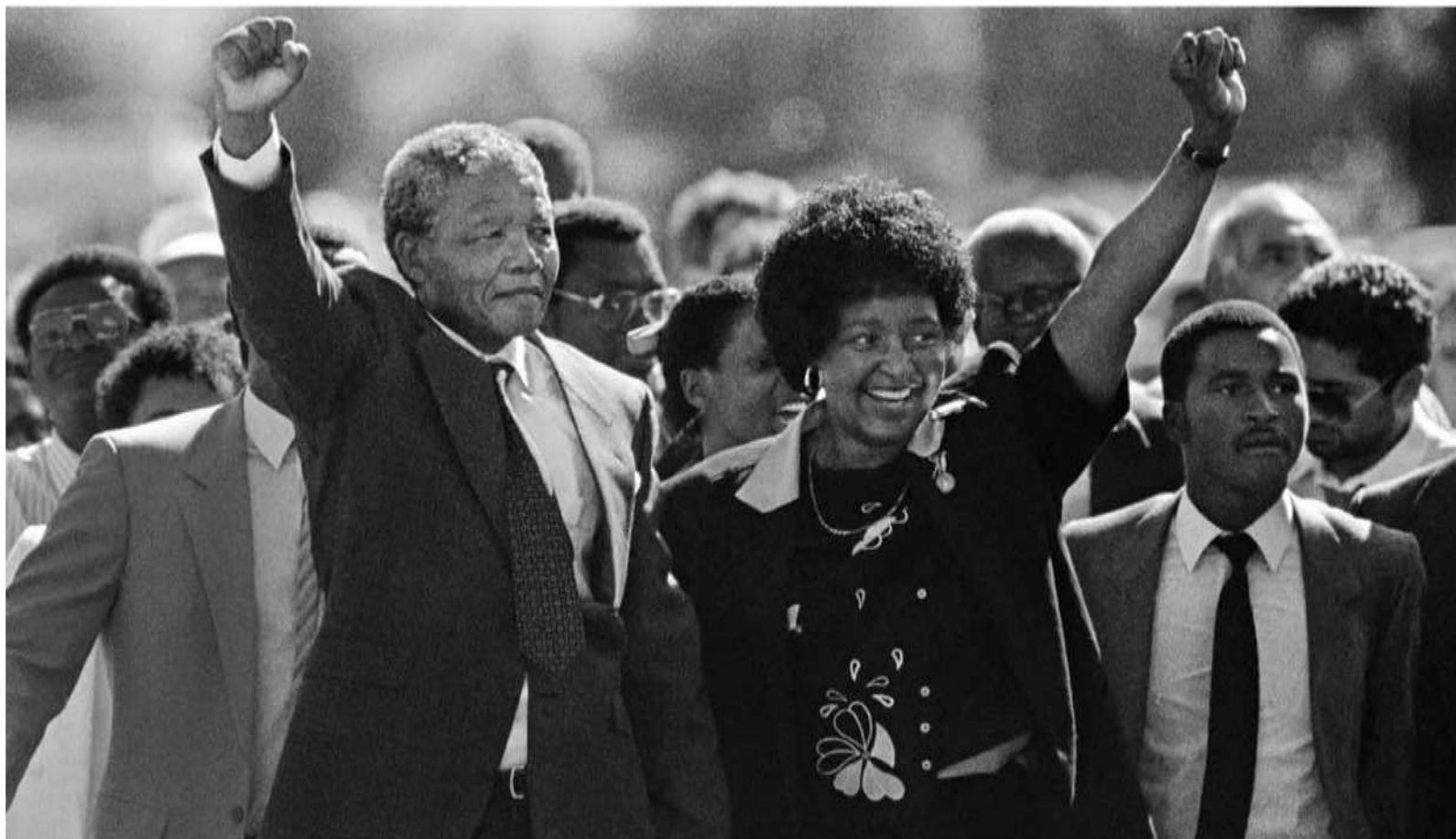
نلسون ماندلا در راهپیمایی آزادی پس از بیش از دو دهه در زندان، در کنار وینی مادیکیزلا- ماندلا، همسر خود در آن زمان، / ۱۱ فوریه ۱۹۹۰، پارل، آفریقای جنوبی