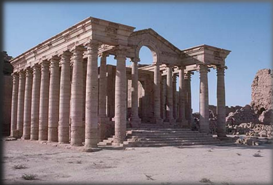
اشکانیان - مهراڻ خواجه

شهر هترا در فاصله ۳ کیلومتری رودخانه دجله و در جنوب غربی موصل واقع است. بنای شهر مربوط به سال ۱۱۷ میلادی است و حصار دور شهر شکل چند ضلعی دارد. در فاصله هر متر برجی قرار گرفته است. در پشت دیوار شهر خندقی حفر کرده بودند و شهر دارای ۴ دروازه در چهار جهت بوده است. معروفترین بنای شهر هترا، نیایشگاه خورشید بوده است.