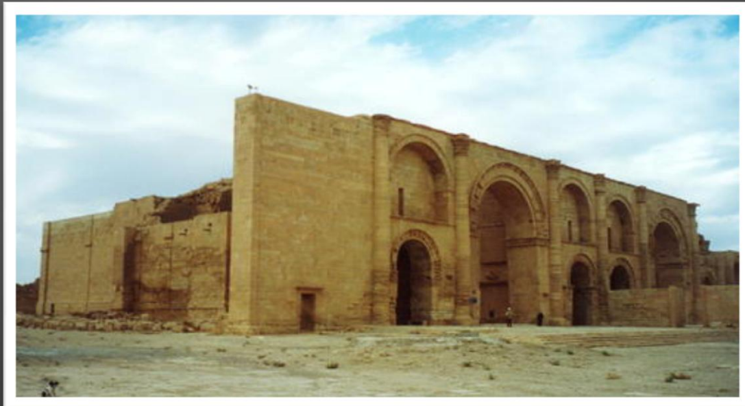
اشکانیان - مهراڻ خواجه

کاخ نساء در عشق آباد ( اشک آباد ) و در حاشیه ی غربی بیابان قره قوم واقع است . این کاخ مربوط به قرن دوم و سوم قبل از میلاد و بنای آن چهارگوش است و چهار ایوان دارد . تالار بزرگ آن دارای سه ایوان است . سقف این تالار چوبی است که بر چهارستون به هم چسبیده استوار شده است .