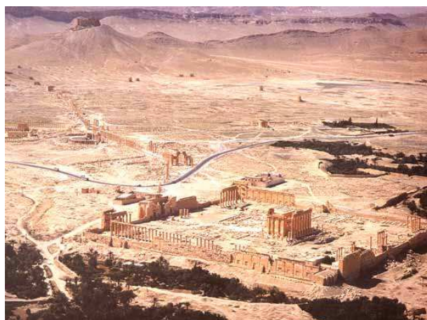
آثار بر جای مانده از شهر تدمر در قلب صحرا

دست کاهنان بود و دوم از اواسط قرن ششم ق. م . تا انقراض که سلاطین مقتدر و غیر دینی و مذهبی به قدرت رسیدند. در دوره اول، پایتخت آنها شهر صرواح بوده است . در سال ۱۱۵ ق.م . قوم حمیر که باز از مناطق جنوبی شبه جزیره بودند ابتدا بر ممالک قتبانی و بعد بر سبا تسلط یافتند. در قرن دوم مسیحی حبشی ها ( شمال افریقا ) بر ممالک تحت نفوذ حمیریها استیلا یافتند و پای مبلغین و مروجین مسیحیت را به شبه جزیره و به ویژه منطقه یمن باز کردند و کلیساهای مسیحی را بر پای نمودند! ( داستان حمله ی ابرهه به مکه و شکست وی توسط خدای کعبه از همین جا نشأت می گیرد! ) حمیریها که از تسلط حبشی های مسیحی و بیگانه بر خاک خود نا خشنود و نا خرسند بودند، سر انجام به دربار ساسانیان روی آوردند و از خسرو انوشروان استمداد طلبیدند! دولت ایران در حدود سال ۵۷۰ م . به یمن لشکرکشی کرد و حبشی ها را شکست داد و خود بر یمن فرمانروا شد!