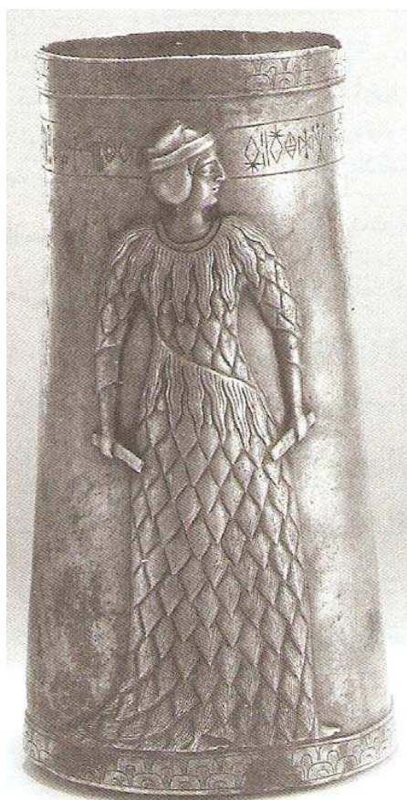
تصویر یک زن ایلامی

را گم می کنند تا هم دلی خالی کرده باشند و هم اجازه ندهند که دانه ی گردی بر دامن پاک و از گل منزه تر اسلام عزیز و نجات دهنده بنشیند!!