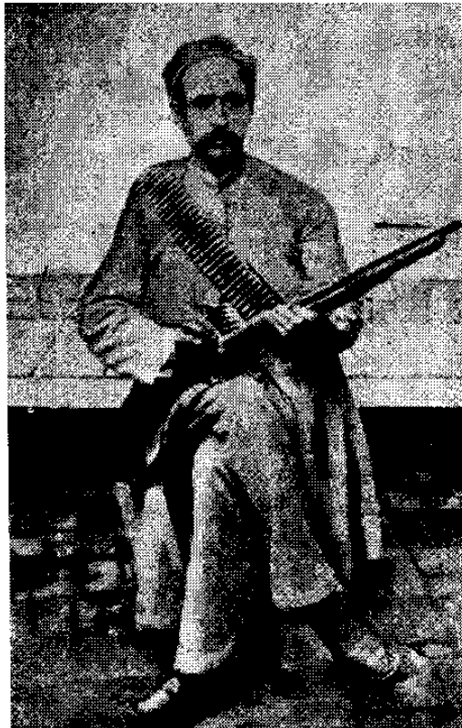
ستارخان - گرد آزادی (این پیکره را ویراینده افزوده)

در این چهار ماه من ناچار بودم در خانه نشینم و با خواندن کتاب هایی (که کم می داشتم) روز گزارم. یک چیزی که مایه دل آزرده می شد این می بود که چنانکه نوشته ام مردان خانواده ما بدخواه مشروطه می بودند. مردم کوی نیز بیشتر همین حال را می داشتند. اینان گرد می آمدندی و بسخن می پرداختندی و همه بد مشروطه را می گفتندی و هر روز دروغ های بسیاری درباره شکست آزادیخواهان در آن کوی پراکنده گردیدی. من از کمسالی که هفده ساله می بودم بسخنی پرداختمی و سهش ۱ های خود را پنهان داشتمی. چون کار مشروطه خواهان پس از بدی رو به نیکی گزارده و در سایه مردانگیهای ستارخان و دیگران روز بروز مشروطه خواهی به نیرو می افزود، این آگاهی ها که به من رسیدی بسیار خشنود گردانیدی. نیک به یاد می دارم که از شنیدن نام های ستارخان و حسین باغبان و دیگران دلخوشی بسیار می یافتمی.