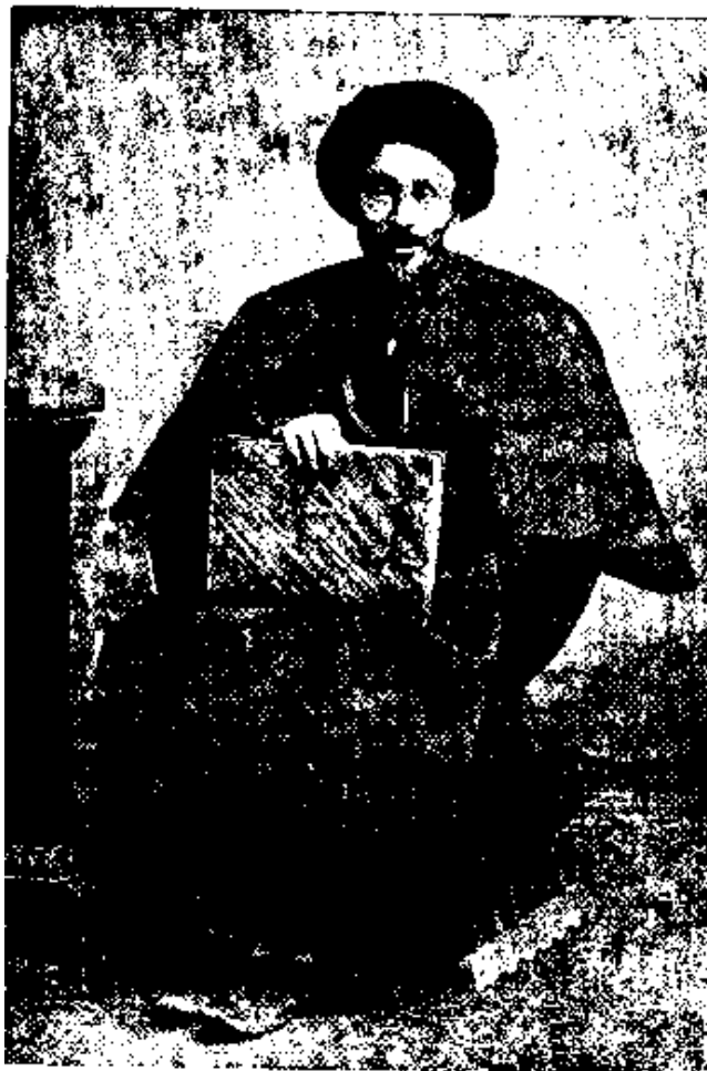
سید جمال الدین اسپهانی

پدرم اندامی باریک، بالایی میانه، ریش کوسج، رُخساره گندمی می داشت. از او پیکره نمانده ولی هر زمان چشمم به پیکره سید جمال الدین واعظ اسپهانی (واعظ مشروطه) افتد پدرم را به یاد آورم. در رخساره بسیار مانند هم میبوده اند. تنها چشم های پدرم درشت تر و دستاری که بسر میگذاشت کوچکتر می بود.