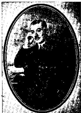
سید جلیل اردبیلی

پس از رفتن ایشان مکرم الملک نامی از اعیانزادگان تبریز «نایب الایاله» شد، و این مرد از دشمنان آزادی می‌بود و پی آزار آزادیخواهان می‌گشت. ولی در بیرون آدمکشی‌های خیابانی و نوبری و دیگر کارهای ایشانرا بهانه می‌گرفت. همچنان کارهای بد برخی از دموکراتها را به رخ ما می‌کشید.