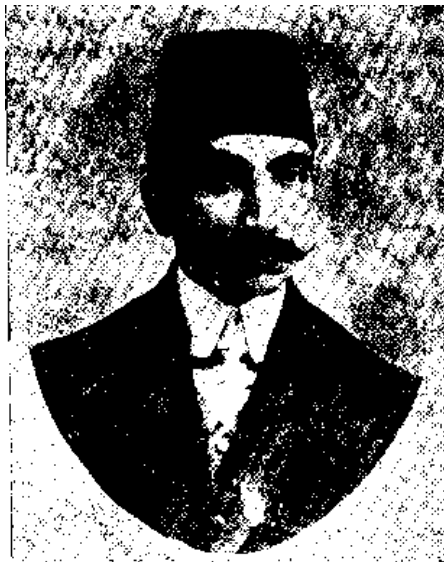
میرزا تقیخان رفعت

بدینسان نشست پایان یافت، و چون پس از چند روز خیابانی و نوبری که از دستگیری رهیده ۳ بودند به تبریز بازگشتند، در میان آمد و رفت ها و گفت و شنیدها دانسته شد خیابانی از کارهای ما رنجیده می باشد و اینست میرزا تقیخان را همچنان از رازداران خود می شناسد. سپس دانسته شد میانه او با نوبری رمیدگی هست، که چون مکرم الملک کشتن امام جمعه و دیگران را دستاویز گرفته کشندگان را دنبال می کند، خیابانی سود خود را در آن دانسته که همه آن کارها را به گردن نوبری بیندازد و خود را کنار گیرد. نتیجه این رفتار او آن شد که نوبری در تبریز ماندن نتوانست و به همدان گریخت. مکرم الملک نیز چند کس را بنام آنکه امام جمعه و دیگران را کشته اند گرفت و بدار زد و کسی به آنان یا به خانواده هاشان یاوری نکرد.