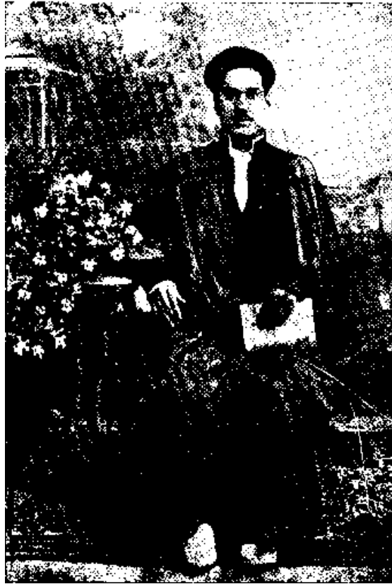
نویسنده کتاب در ۳۱ سالگی

مثلاً یکی از جُستارهایشان ۱ بدین عنوانست: «آیا مقدمه واجب واجبست؟». خودشان مثل زده چنین می گویند: «آقای به غلامش فرموده برو بالای بام. رفتن بالای بام واجبست و جای سخن نیست. ولی آیا نردبان گزاردن که مقدمه آنست نیز واجبست؟».