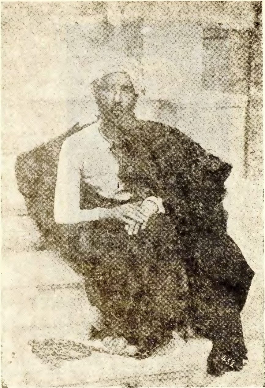
عکس میرزاجاکرمانی از شیفتگان فیلسوف شرق سید جمال‌الدین اسدآبادی بیهمال در ایامی که در سیاهچال تهران باغل و زنجیر در گردن و پهاها و تحمل شکنجه بسر می‌برد . نورالدین چهاردهی