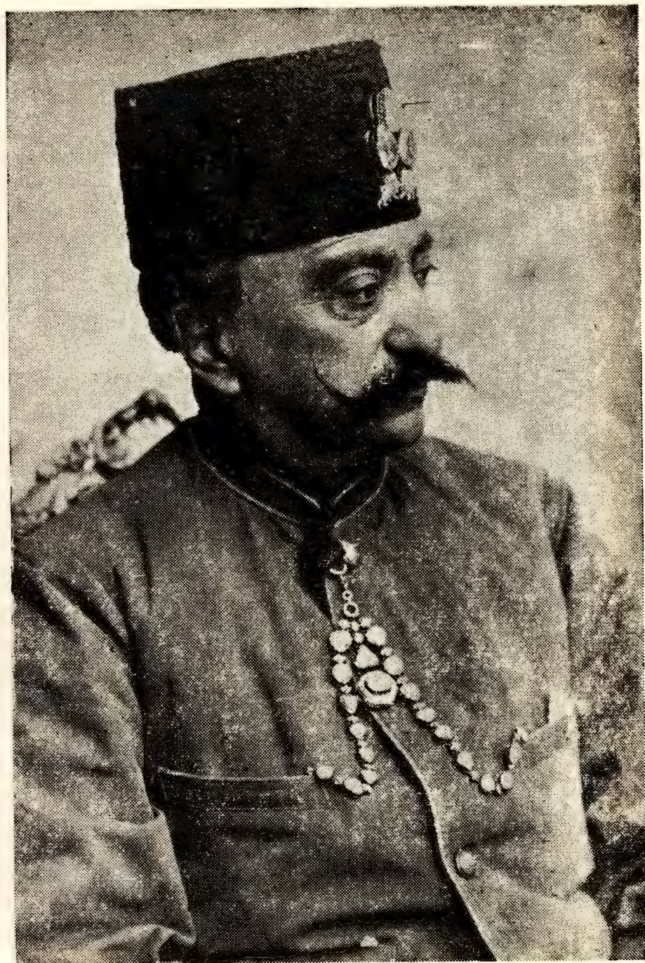
ناصرالدين شاه قاجار