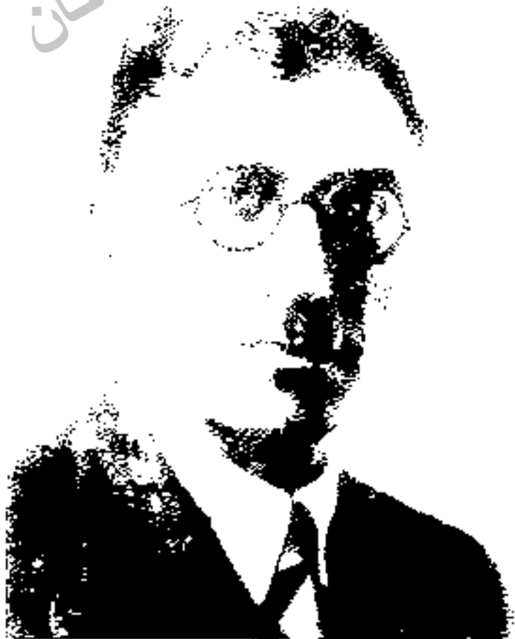
کبر میرزا مسعود (حارم الدوله): وزیر در دولت پهلوی. مجری ملی فیروز و پهلوی کبریا: حارم الدوله.