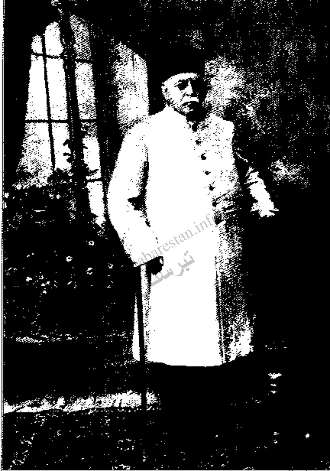
عبدالحسین میرزا قاسم‌ما‌ی‌یان (قاسم‌ما‌ی‌یان): رئیس‌الوزرای اسبق، یکی از بانفوذترین سیاستمداران عصر خود بود. وقتی او به آگره به سلطنت رضاخان رضایت داد، انتقال قدرت به سهولت انجام پذیرفت.