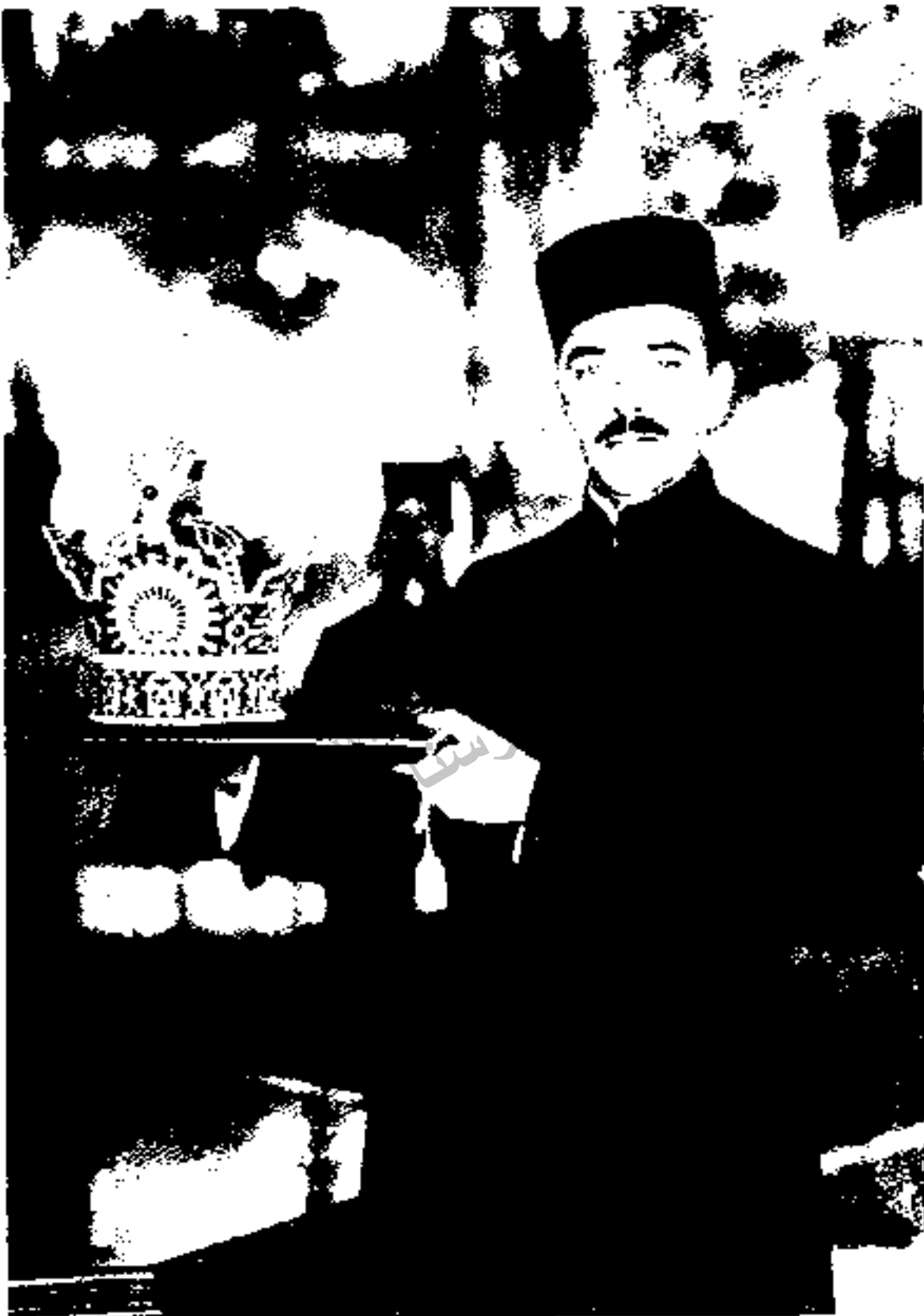
عبدالحسین تیمورتاش (سردار معظم): تعزیه گردان اصسی دستگاه رضا شاه در ابتدای کار. نزدیک هفت سال بازار عاز و سایه شاه بود، سپس مورد بی مهری قرار گرفت و به دستور شاه سر به نیست شد.