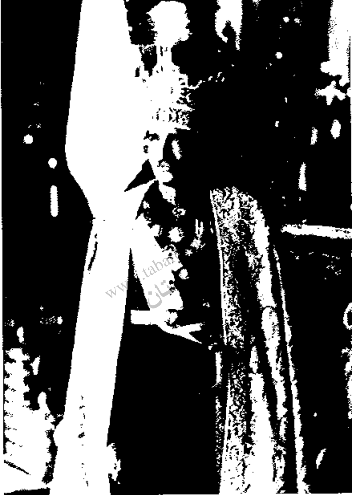
رضاشاه: سرهنگ سابق قزاق، هنگام تاجگذاری به سنت پشت کرد و به دست خویش تاج بر سر نهاد و خود را شاهنشاه خواند.