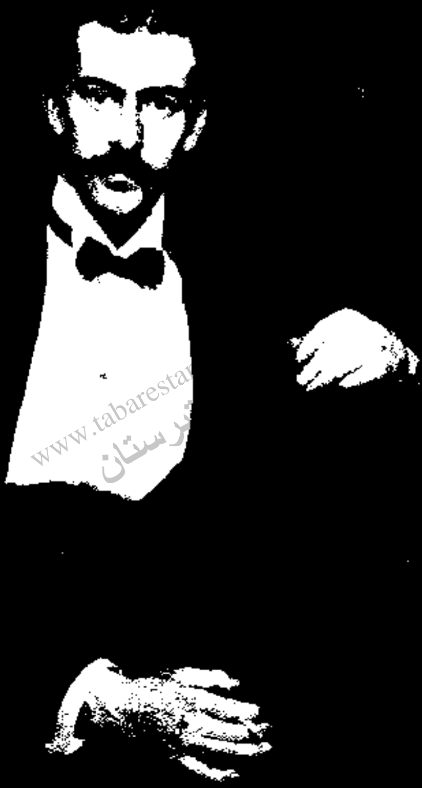
سِر پرسی لورین، به یزی گروز در ۱۹۲۱ وزیر مختار انگلیس در ایران شده. در طول پنج سال مأموریت خود به سیاست دیرین لندن در ایران شک آورده و از تضعیف حکومت مقتدر مرکزی سر باز زد.