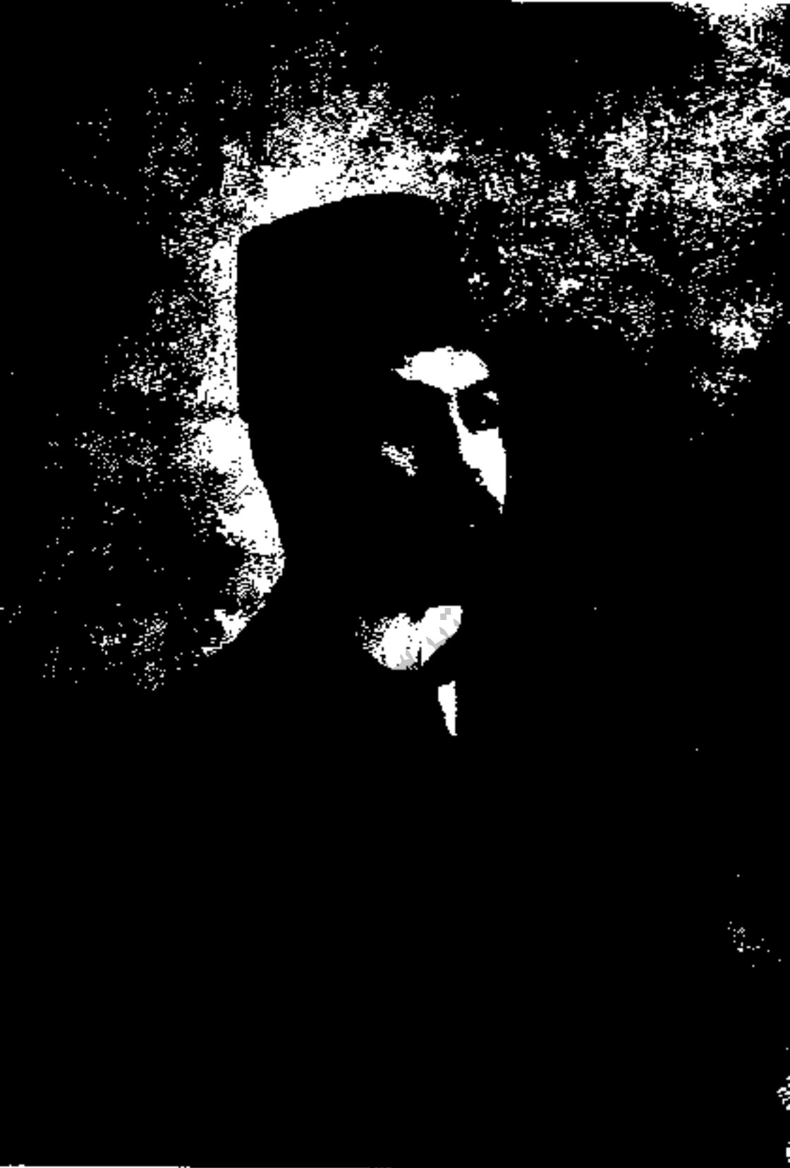
حسن پیرنیا (مشیرالدوله): در دامنه سالهای ۱۲۹۳ تا ۱۳۰۲ چندین بار نخست‌وزیر شد. مرد دانشمند و درستی بود، از اجزای فرارده ۱۹۱۹ خودداری ورزید.