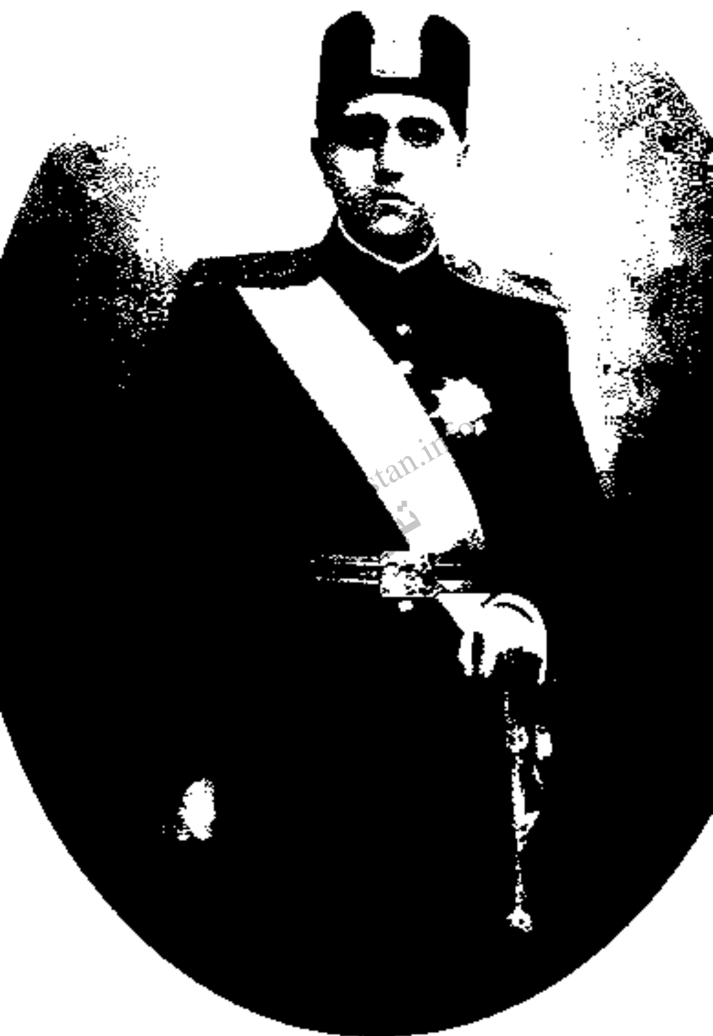
احمدشاه: آخرین پادشاه قاجار. مردی پوزپرست و ضعیف‌الکفی بود و نیز آسایی در فرنگ را به معضلات فرمانروایی در وطن ترجیح می‌داد.