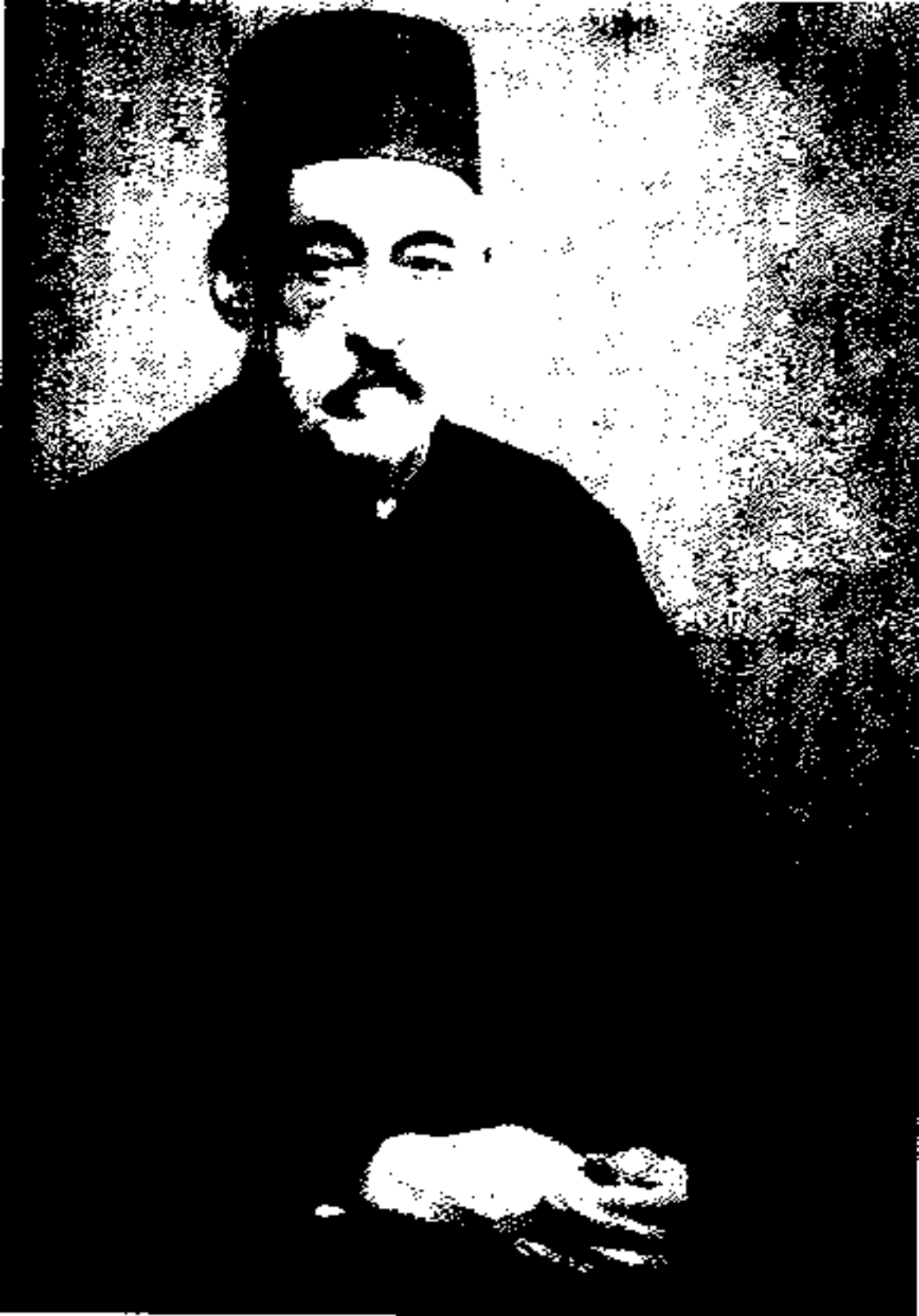
مهدیقولی خان هدایت (مخبرالسلطنه): وزیر و وکیل لایق و درستکار زمان فاجعه. در زمان رضاشاه نخست‌وزیر شد و سال‌ها زیاد در این سمت خدمت کرد.