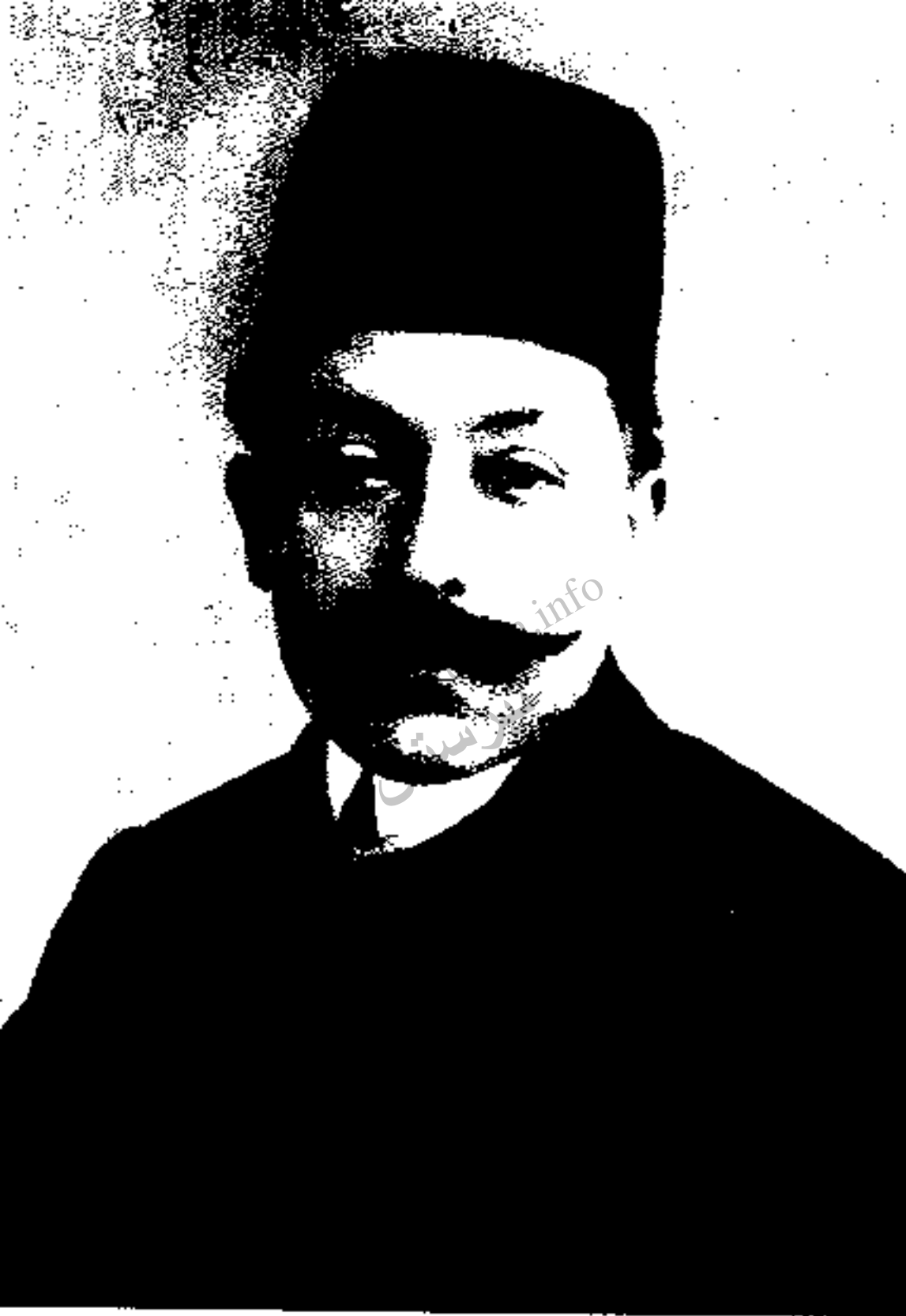
احمد قوام (قوام السلطنه): برادر کوچک و ثوق الدوله، در فاصلهٔ سالهای ۱۳۰۰ تا ۱۳۰۱ دو بار رئیس الوزرا شد. سیاستمداری مکار و فاسد بوده؛ روابط ایران و امریکا را گسترش داد.