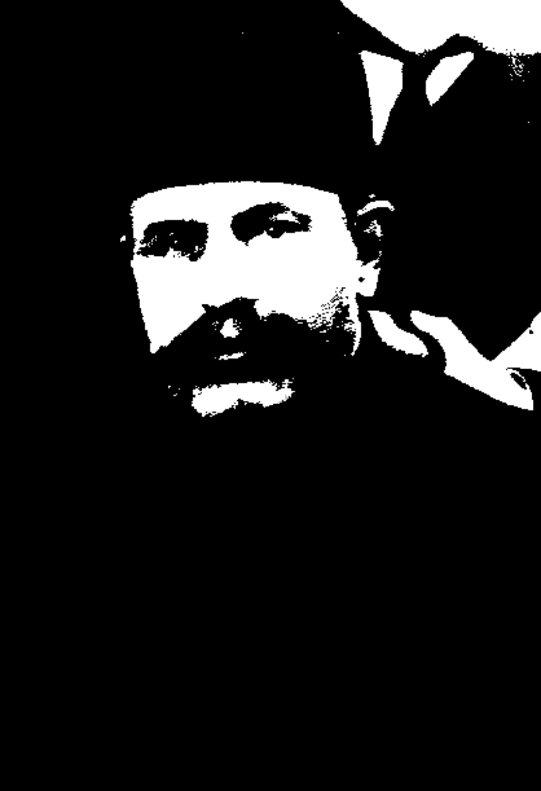
فتح الله اکبر (سپهبدار): این سیاستمدار ناتوان از قضا در موقع کودتا رئیس الوزرای موقت کشور بود که با کودتا از کار برکنار شد.