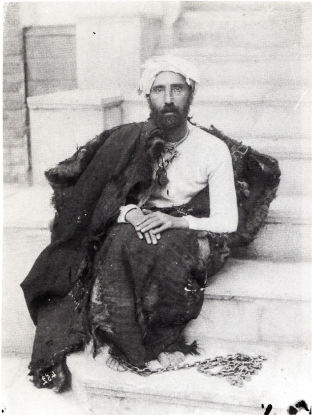
«... از کندها و بندها که به ناحق کشیدم و چوبها که خوردم... چهار سال و چهارماه در زنجیر و کند بودم...» صفحه ۱۰۱