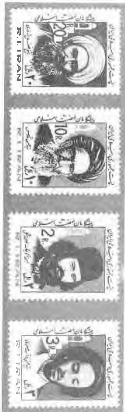
۸ تصویرهای یادبود پیشگامان بهمنیت اسلامی (از چپ به راست) شیخ فضل الله نوری، سید حسن مدرس، میرزا کوچک خان جنگلی، سید محمد مجتبی نواب صفوی