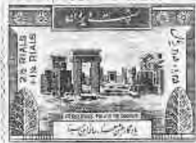
۱۴ تخت جمشید: آثار کاخ اصلی

۴ نمبرهای مرتبط با جشن‌های باستانی ایران