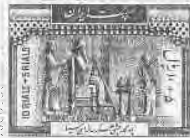
۳۰۴ تخت جمشید: داریوش