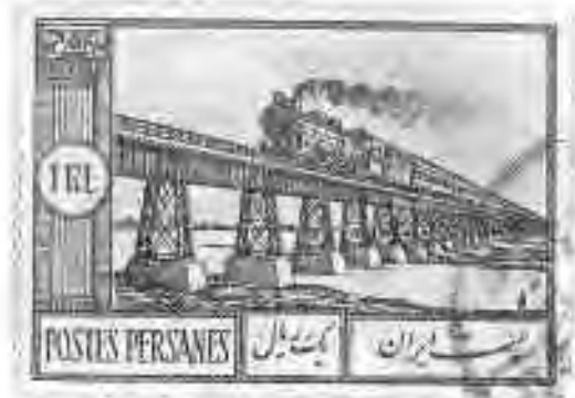
۶۳ پل کارون در خوزستان