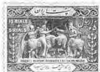
۶ ۴ کنده‌کاری‌های نقش رستم: اعطای نصاب شاهی اردشیر توسط اهورمزدا