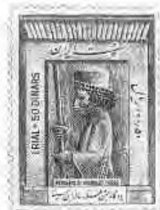
۴ ۴ تخت جمشید: سرباز جنگی