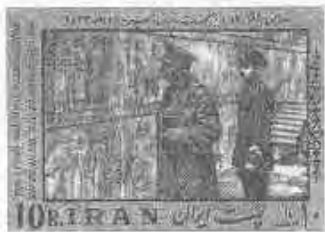
۲.۵ بزرگداشت رضاشاه پهلوی