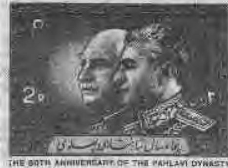
۳.۵ تمیرهای مرتبط با بزرگداشت پنجاه سال شاهنشاهی پهلوی