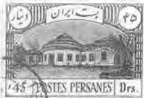
۳۳ آسایشگاه تهران