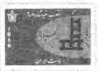
۱.۵ تمبرهای بزرگداشت انقلاب سفید