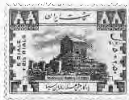
۵ ۴ پاساژگان: آرامگاه کوروش