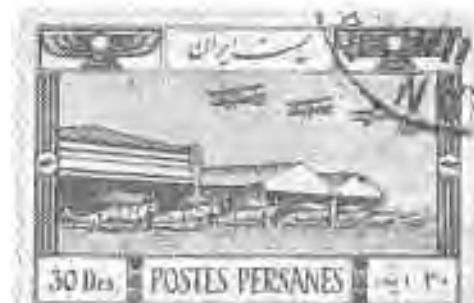
۴۳ فرودگاه تهران