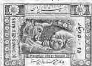
۲۰۴ تخت جمشید: نبرد شیر و گاو