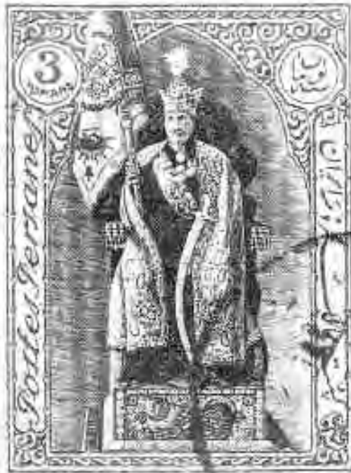
۱ تمبر تاجگذاری، ۱۳۰۵

* خاندان تودور (Tudors) طی سده‌های چهارده و پانزده بر انگلستان حکومت کردند. خاندان بوربون (Boutbons) از دودمان‌های مهم پادشاهی به‌ویژه در فرانسه طی سده‌های شانزدهم تا هیجدهم (زمان انقلاب فرانسه) بودند هابسبورگ‌ها (Habsburges) نیز خاندانی آلمانی‌الاصل و یکی از سلسله‌های عمده حاکم بر اروپا (عمدتاً مناطق آلمانی‌زبان) در سده‌های پانزدهم تا بیستم به‌شمار می‌روند دولت‌های مطلقه تودور، بوربون و هابسبورگ پیش درآمد «دولت-ملت‌های» مدرن محسوب می‌شوند. تا پیش از پیدایش دولت‌های مطلقه در سده‌های شانزدهم و هفدهم، حکومت در وجود فرد فرمانروا و حاکم معنی داشت و در واقع بسط و گسترش وی بود اما با پیدایش دولت‌های مطلقه فوق، حکومت از وجود فرد حاکم جدا و به‌عنوان نهادی مستقل مطرح شد که فراتر از خود فرمانرواست و پس از وی هم ماندگار است - م