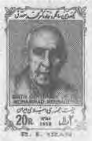
۴.۸ تمبهای منتشره توسط دولت بازرگان: بزرگداشت جلال آل احمد، سرپرستی، محمد مصدق و علامه دهخدا