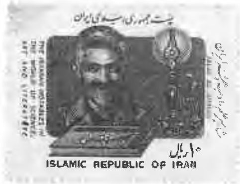
۵.۸ تمبهای مرتبط با سالگرد پیروزی انقلاب اسلامی در سالهای مختلف دهه ۱۳۶۰/۱۹۸۰