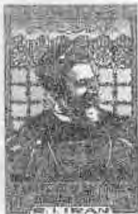
۱۰۸ یادبود شهادت آیت الله بهشتی و هفتاد و دو تن از شهدای هفتم تیر