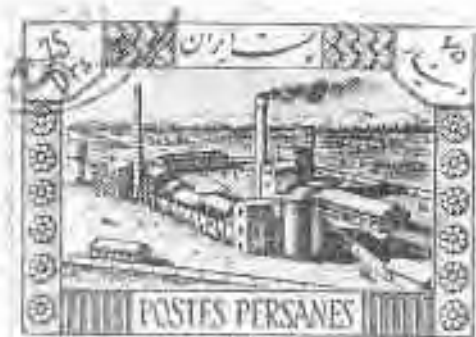
۴۳ کارخانه مسلمان ری