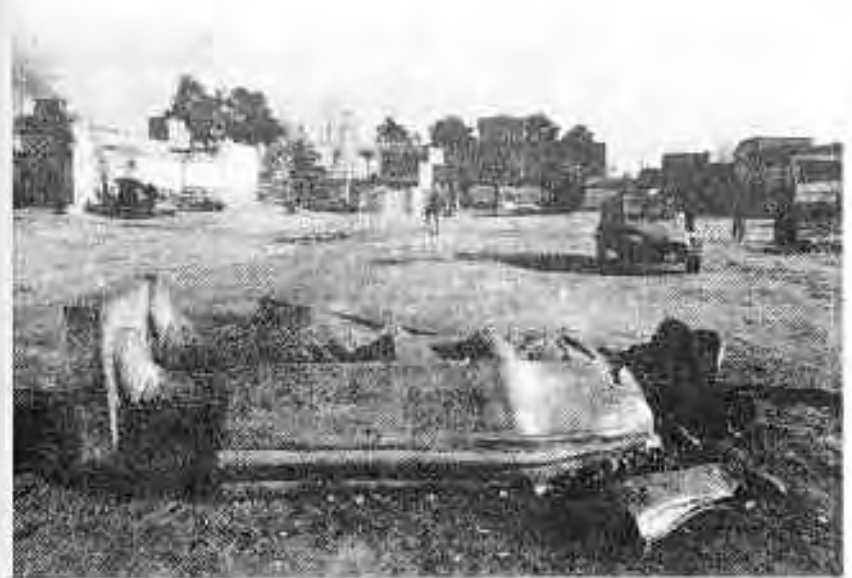
مجموعه محمد رضا شاه پهلوی روی زمین

[آیت‌الله] خمینی در دوازده بهمن ماه یعنی دو هفته پس از خروج شاه از کشور، از تبعید به ایران بازگشت. جمعیتی که به پیشواز وی آمده بودند به بیش از سه میلیون نفر رسیده بود به طوری که ناچار شد برای رفتن از فرودگاه تا بهشت‌زهرا از هلی‌کوپتر استفاده کند. وی در آن‌جا مقام «ده‌ها هزار تن از شهدای انقلاب» را گرامی داشت. براساس ارقام رسمی رژیم جدید، شمار کشته‌شدگان انقلاب ۶۰۰۰۰ نفر بود [اما] میزان رقم واقعی احتمالاً کم‌تر از ۳۰۰۰ نفر بوده است. ۴ بنیاد شهید انقلاب اسلامی بعدها یک بررسی در خصوص کشته‌شدگان انقلاب از سال ۱۳۴۲ تا سال ۱۳۵۷ انجام داد که نتایج آن منتشر شد. براساس این بررسی طی یازده ماه - یعنی از آبان ماه ۱۳۵۶ تا بهمن ماه ۱۳۵۷ - در مجموع ۲۷۸۱ نفر در حوادث انقلابی جان