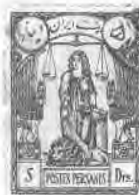
۹۳ نماد عدالت و دادگستری