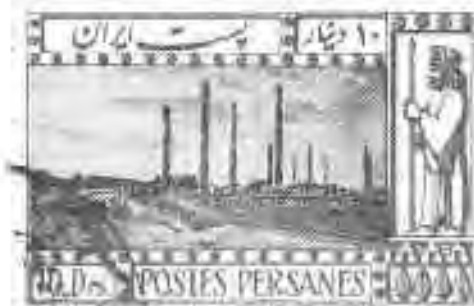
۱۳ تخت جمشید