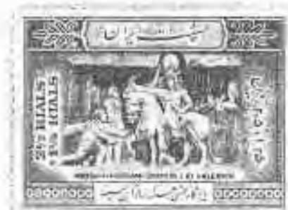
۷ ۴ کنده‌کاری‌های نقش رستم: تسلیم‌شدن امپراتور والرین در برابر شاهپور