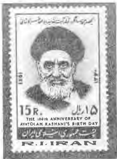
۲۰۸ یادبود آیت الله کاشانی