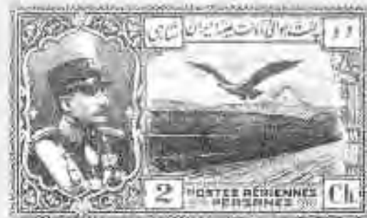
۲ تمبر مرتبط با راه‌سازی در کشور