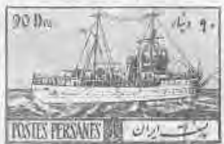
۵۳ ناوچه جنگی