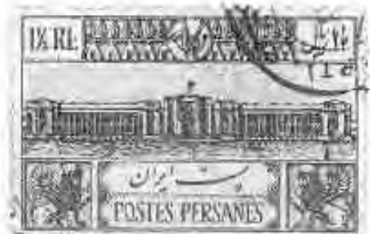
۷۳ ساختمان پست در تهران