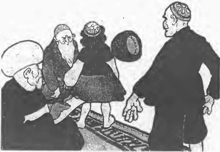
تصویر شماره ۱/۱ آزمایش پرتاب کلاه

در این میان استثناهایی هم بودند. در روستای دَهوک (کرمان) دخترها دیر شوهر می‌کردند و اجازه نداشتند تا ۲۵ یا ۳۰ سال‌شان نشده ازدواج کنند. ۱۳۷ نزد بختیاری‌ها رسم بود که شوهر چهارسال از زن سال‌دارتر باشد، گرچه خان‌های پیر با دختران جوان تنگ‌دست هم‌ایلی‌شان نیز ازدواج می‌کردند. ۱۳۸ به‌طور کلی گویا پسرهای ثروتمندان از پانزده ساله‌گی صیغه می‌کردند و در بیست ساله‌گی زن عقدی می‌گرفتند. گاه نیز پیش می‌آمد که «به دلایل خانوادگی جوانی پانزده یا شانزده ساله با دختری مسن‌تر از خود ازدواج می‌کرد.» ۱۳۹