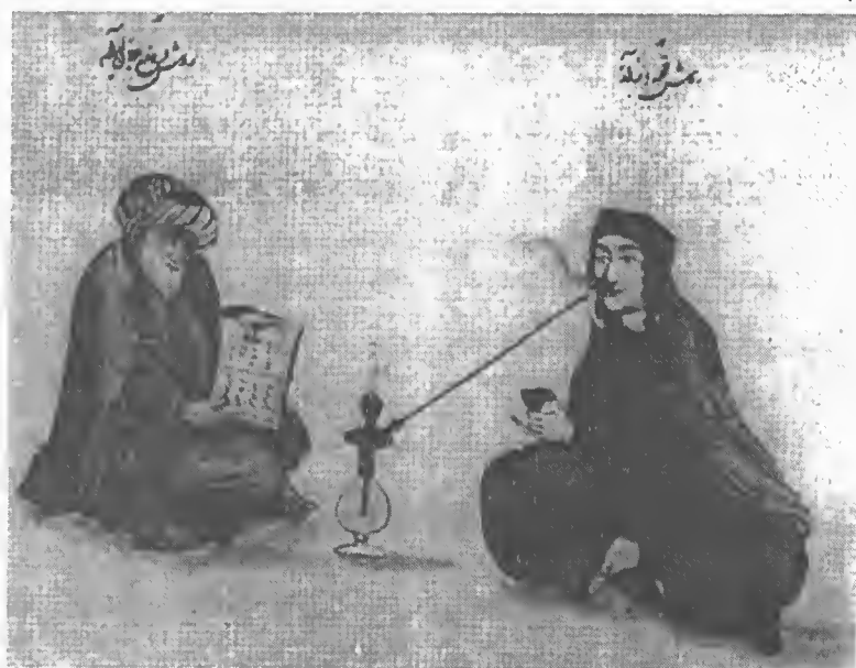
تصویر شماره ۲/۱ ملّا و صیغه

بنا بر مشاهدات دومان در ایران صفوی روسپی‌گری کم‌تر از اروپای آن روزگار شرم‌آور و مایه‌ی ننگ بود. این بدین خاطر است که او نیز چون شاردن فرق روسپی‌گری و زناشویی موقت را در نمی‌یافته. ۳۳ عکس زیر که یک ملّا و یک روسپی را تصویر می‌کند احتمالن بر پایه‌ی همان بدفهمی استوار است. زن توی تصویر به احتمال بسیار یک صیغه است، نه روسپی. این تصویری سنت از درون یک خانه و زن و مرد در آن کاملن با هم راحت‌اند، احتمالن منتظر مشتری‌اند تا بیاید عقدِ زناشویی موقت با زن ببندد.