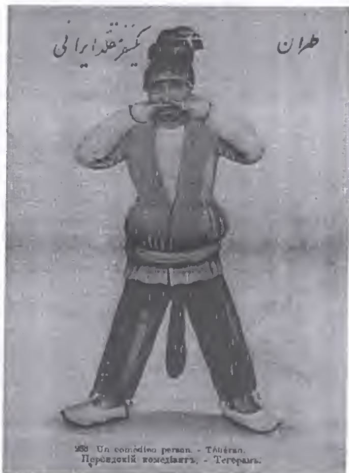
نصویر ۴ بازیگری ایرانی با کبر مصنوعی

سال ۱۳۲۶ حاکم تهران اسداله خان را چوب فلک کرد. اسداله خان از زیباترین جوانان تهران و از کونی‌های به‌نام بود که عاشقان بسیار داشت. ۲۲۹ با آن که همجنس‌خواهی آشکار در هنر و ادبیات، بر اثر این نگرش به لحاظ سیاسی درست، ناپدید شد و نفرت از آن جانشین‌اش شد، در رفتار مردم تغییری پدید نیامد، زیرا بسیاری از مردان هنوز واله و شیدای پسران بودند.