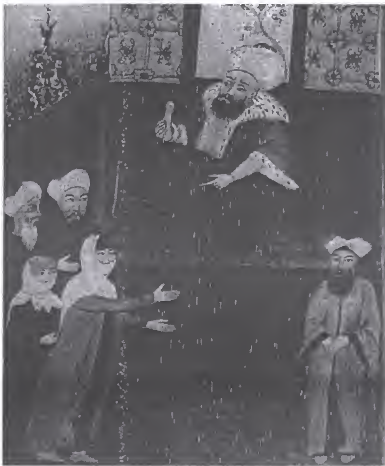
تصویر ۱/۴ زن ناراضی یک مهاجرت را به نشانه‌ی ناتوانی جنسی شوهرش به قاضی نشان می‌دهد (از حمزه‌ی عطایی)