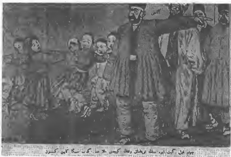
تصویر شماره ۱/۲ به دختر بچه امر می‌شود که به خانه شوهر برود

این جور زناشویی با مردان مسن برای دختر بچه‌ها ضربه‌ای روحی بود. به نوشته‌ی دکتر ویشارد دخترک‌ها از چنین زناشویی‌هایی بدجوری صدمه و آزار می‌دیدند. «دختر بچه‌هایی را دیده‌ام به بیمارستان آورده‌اند که اسم شوهرشان را که می‌آوردند جیغ‌شان به هوا می‌رفت، چه رسد به این که به‌شان می‌گفتند برگردند خانه‌شان.» ۱۴۱